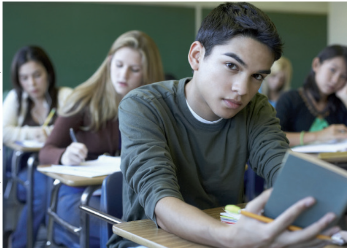
Photos sous licence, les personnes représentées sont des modèles professionnels.

Nous espérons amener les jeunes à s'interroger sur leurs comportements. La place qu'ils donnent aux préjugés et leur attitude face à l'inconnu.